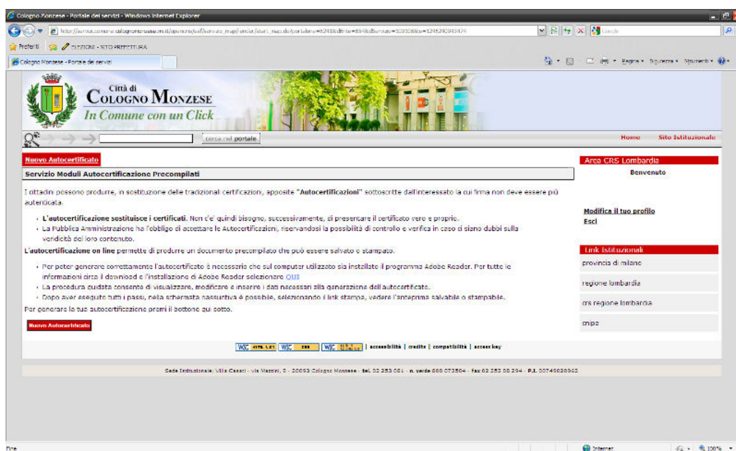
Pagina Iniziale Servizio